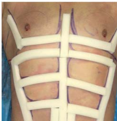
Figura 3. Bandas diseñadas para la lipomarcación post quirúrgica en el abdomen (7).

La lipomarcación en el hombre es diferente que en la mujer (Figura 3), ya que el contorno horizontal de las 3 inserciones del recto abdominal en las mujeres suele ser antiestético.