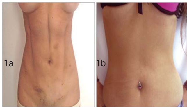
Figura 1a. Preoperatorio (se aspiró 3 litros de grasa incluyendo lo infiltrado)

Se dio relevancia a la marcación de los límites de los músculos rectos abdominales, línea semilunar, línea alba, músculo transverso, sus inserciones tendinosas y hueco axilar. (Figuras 1A y B).