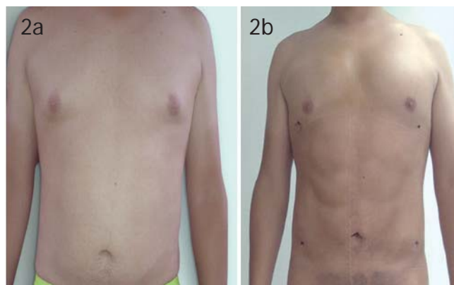
Figura 2a. Preoperatorio (se aspiró 3.200 litros de grasa incluyendo lo infiltrado y se injertó 200 cc de grasa en pectorales: zona supra e infra pectoral).