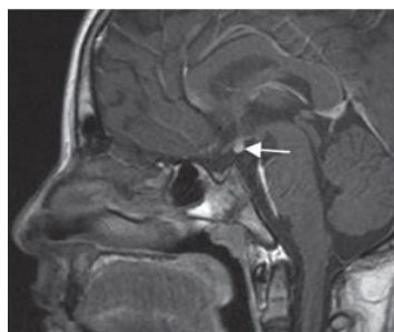
Figura 1. RNM de hipófisis con contraste (gadolinio), corte sagital: adenohipófisis disminuida de altura sin lesiones focales

El resultado de la RNM fue ausencia de representación del infundíbulo-tallo hipofisiario, así como de la neurohipófisis en el nivel intraselar por el presente método de estudio. Adenohipófisis disminuida de altura sin lesiones focales. Imagen con aspecto de neurohipófisis ectópico (Figura 1). Estos hallazgos sugieren el SITH.