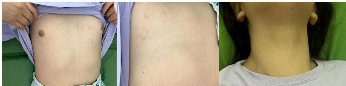
Figura 2. Telangiectasias y alteración en el desarrollo mamario

recibió terapia de reemplazo hormonal con levotiroxina e hidrocortisona. Se indicó control por consultorio externo de endocrinología para seguimiento y manejo (Figura 2).